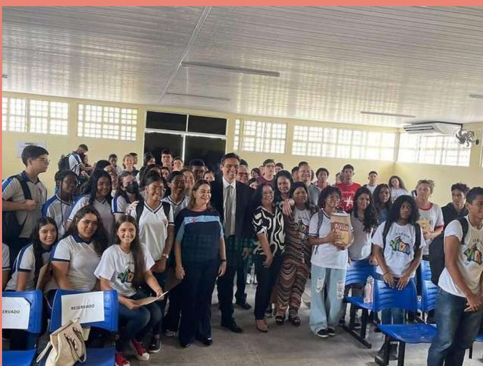
Alunos presentes no evento de premiação do Projeto “Roda de Leitura”, representando as escolas CE João Paulo II, CE Paulo Freire e Centro Educa Mais Professora Estefânia Rosa da Silva.