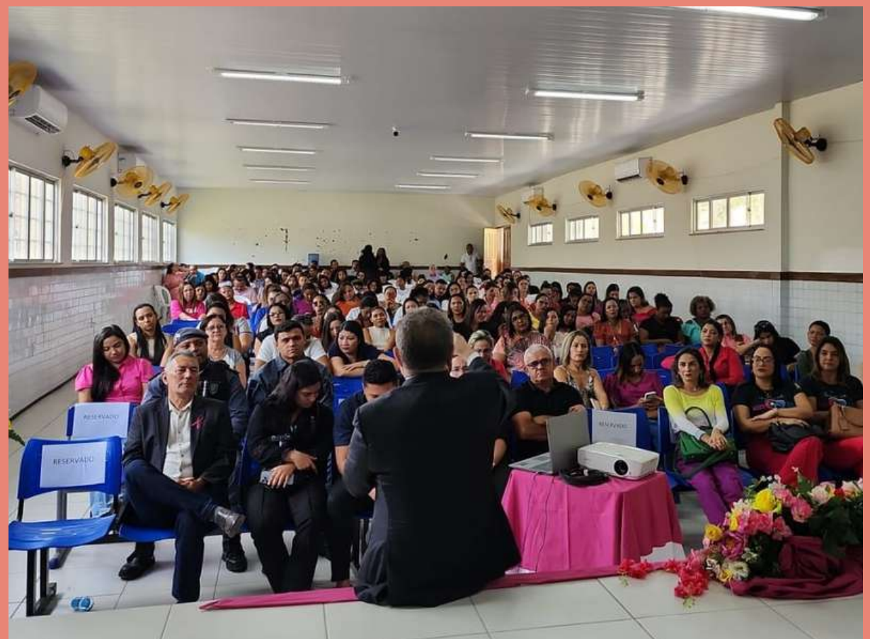
Público presente na Caravana da Mulher “Todos por elas” na cidade de Viana - MA.