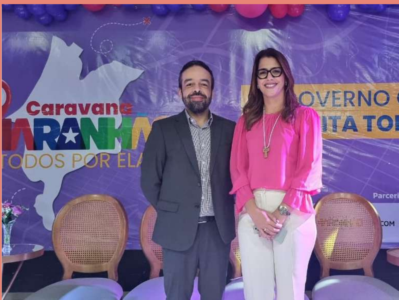
Caravana "Maranhão Todos Por Elas" em Pedreiras - MA.