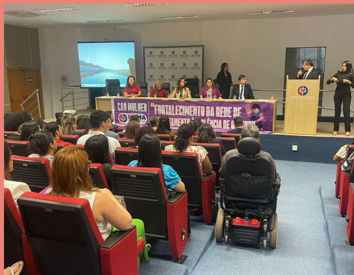
Mesa formada no evento "A Importância dos Grupos Reflexivos no Enfrentamento à Violência Doméstica Contra a Mulher e Como Elemento de Transformação Social" na cidade de Imperatriz - MA.