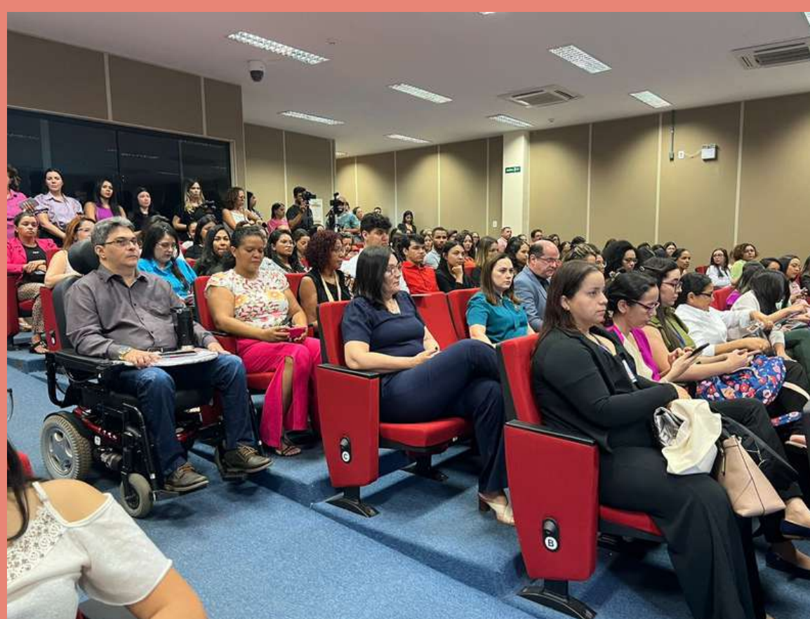
Público presente no evento "A Importância dos Grupos Reflexivos no Enfrentamento à Violência Doméstica Contra a Mulher e Como Elemento de Transformação Social" na cidade de Imperatriz - MA.

DANDO SEQUÊNCIA A PROGRAMAÇÃO DO AGOSTO LILÁS, COMO INICIATIVA DA 8ª PROMOTORIA ESPECIALIZADA DA MULHER DE IMPERATRIZ/MA JUNTO AO CENTRO DE APOIO OPERACIONAL DE ENFRENTAMENTO À VIOLÊNCIA DE GÊNERO - CAO - MULHER E EM PARCERIA COM A ESCOLA SUPERIOR DO MINISTÉRIO PÚBLICO - ESMP/MA PROMOVERAM O EVENTO COM O TEMA: " A IMPORTÂNCIA DOS GRUPOS REFLEXIVOS NO ENFRENTAMENTO À VIOLÊNCIA DOMÉSTICA CONTRA A MULHER E COMO ELEMENTO DE TRANSFORMAÇÃO SOCIAL ", NO DIA 08 (OITO) DE AGOSTO DE 2023.