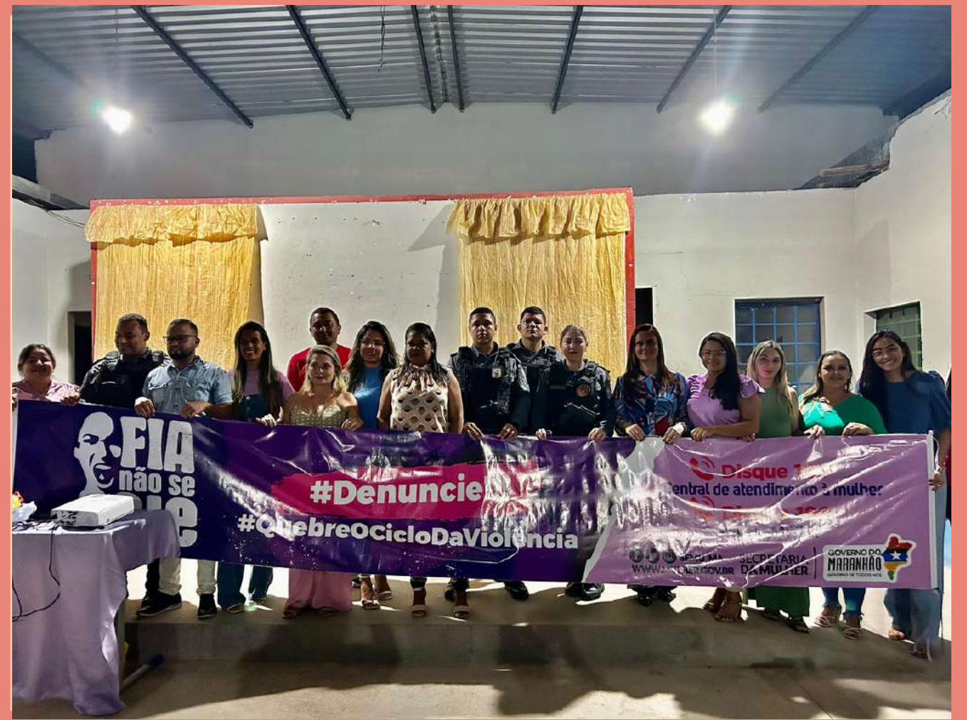
Ciclo de Diálogos sobre a Lei Maria da Penha realizado em Davinópolis, sendo parte do recomendação Nº 89/2022 do CNMP. O evento contou com a participação Secretaria de Saúde do Município e a Patrulha Maria da Penha