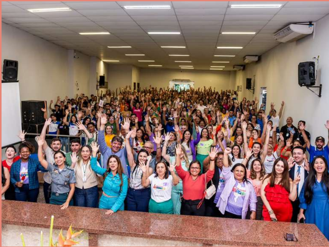
Caravana “Maranhão Todos Por Elas” em São João dos Patos.