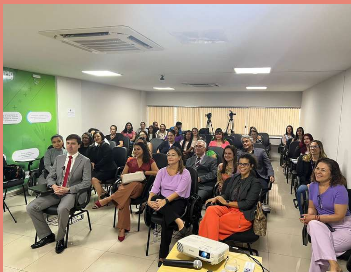
Público presente no curso "Estratégias Contemporâneas no Combate à Violência Doméstica contra a Mulher".