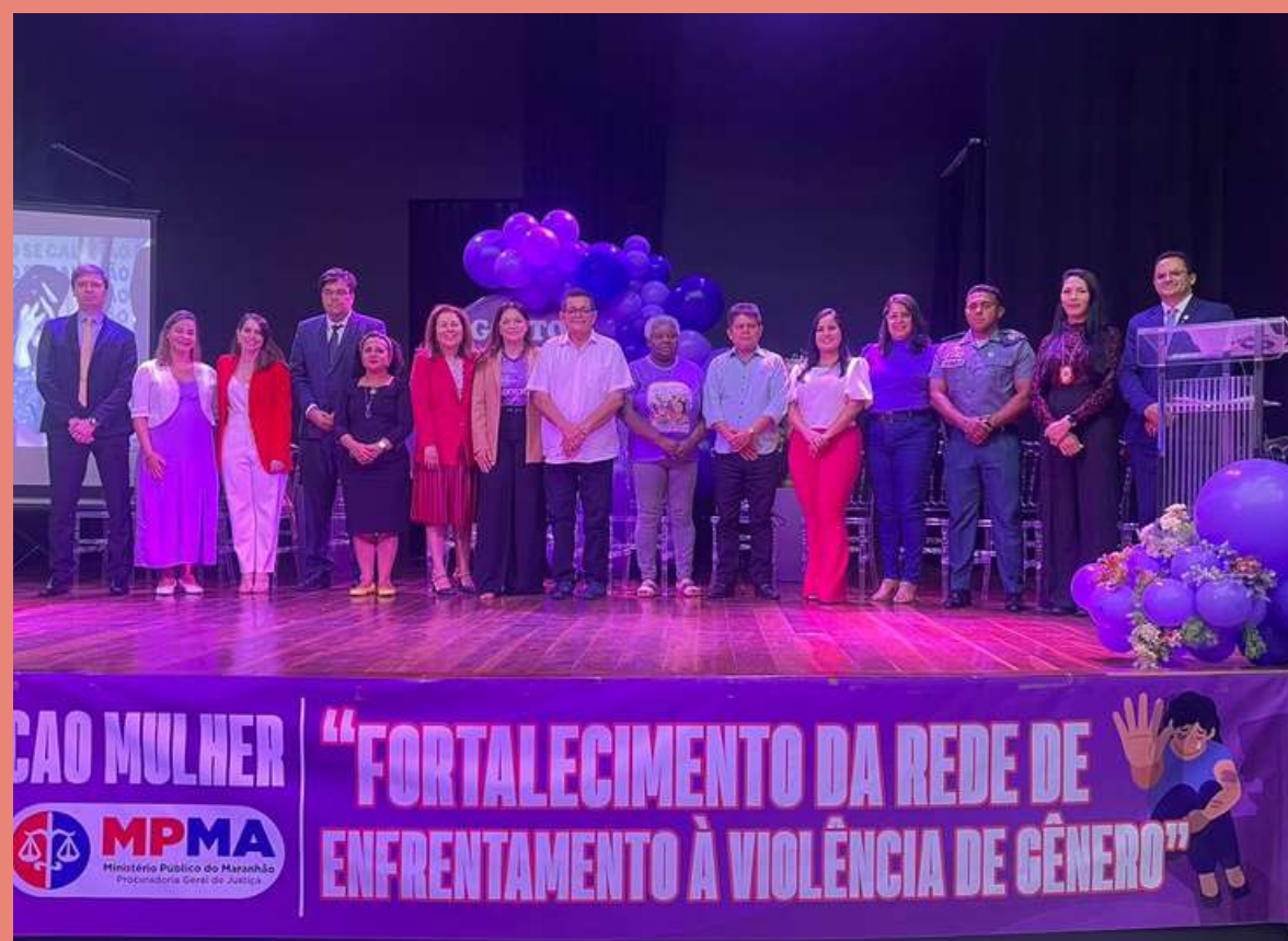
Representantes da Rede de Proteção à Mulher presente no evento "Fortalecendo a rede no Enfrentamento à Violência de Gênero" realizado no município de Açailândia - MA.