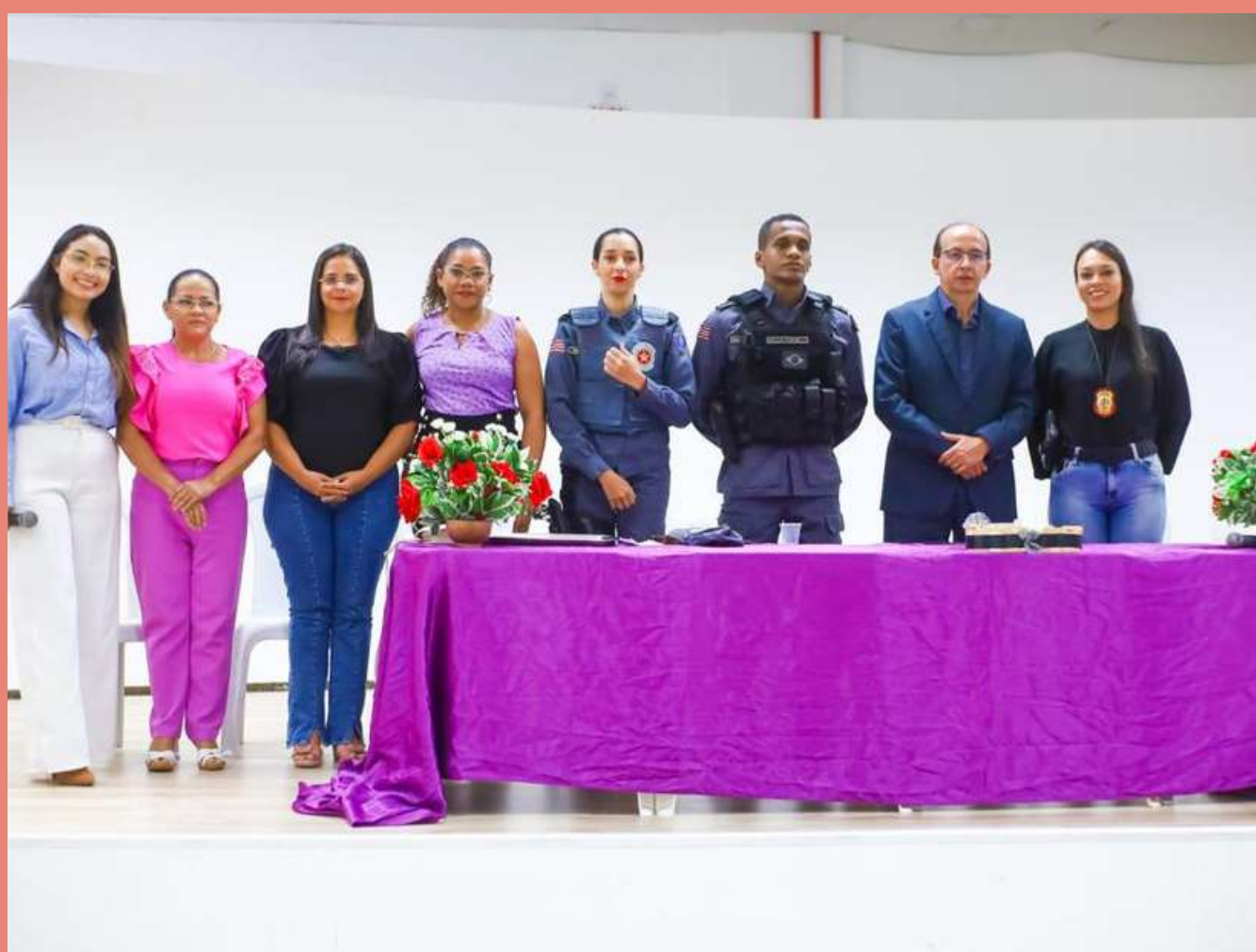
Mesa formada para o evento alusivo ao “Agosto Lilás”, em Santa Helena -MA.