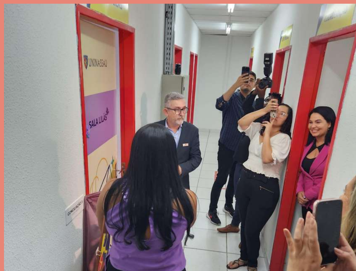
Momento em que foi inaugurada a Sala Lilás, no Centro de Universitário Maurício de Nassau - UNINASSAU.

NO DIA 11 (ONZE) DE AGOSTO DE 2023, O CAO-MULHER PRESTIGIOU O LANÇAMENTO DO PROGRAMA SER MULHER, PROMOVIDO PELO GRUPO SER EDUCACIONAL DO CENTRO UNIVERSITÁRIO MAURÍCIO DE NASSAU - UNINASSAU . O PROGRAMA INTEGRA DIVERSOS PROJETOS, TAIS COMO: A OFERTA DE BOLSAS DE ESTUDOS, APOIO PSICOLÓGICO E ATENDIMENTO JURÍDICO PARA MULHERES VÍTIMAS DE VIOLÊNCIA DOMÉSTICA, COM O INTUITO DE CONTRIBUIR PARA O DESENVOLVIMENTO INTELECTUAL, COMPORTAMENTAL E EMOCIONAL DAS MULHERES VÍTIMAS DE VIOLÊNCIA DOMÉSTICA.