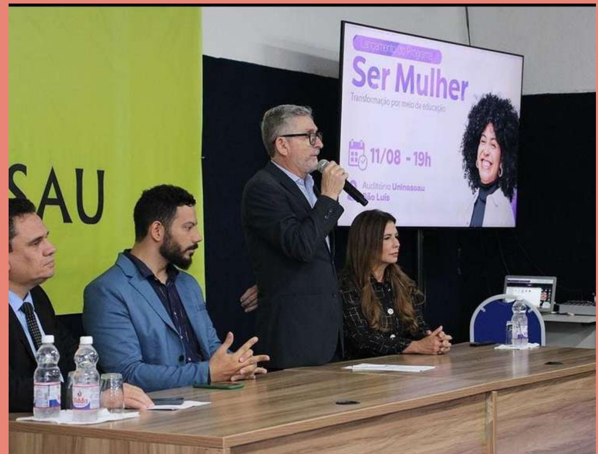
Mesa formada para o lançamento do programa “Ser Mulher” no Centro Universitário Maurício de Nassau - UNINASSAU.