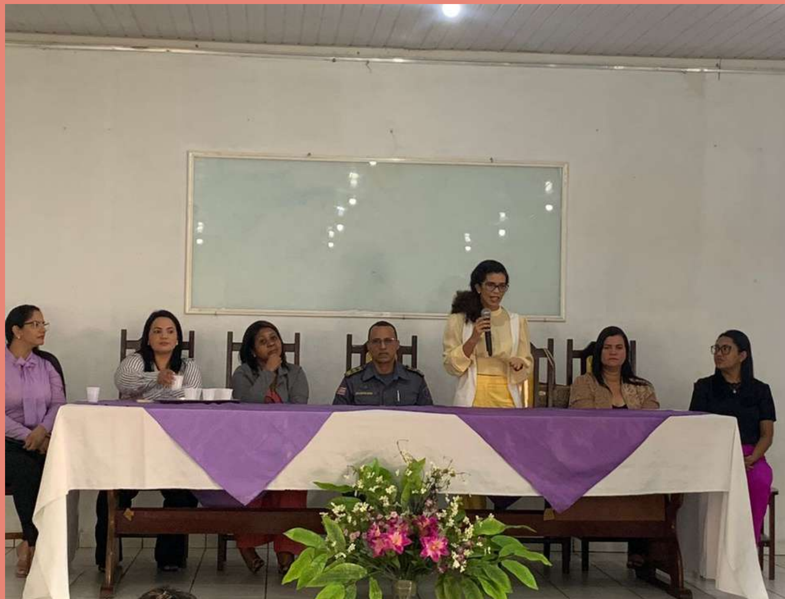
Palestra: sensibilizando as forças de segurança para a importância do combate à violência doméstica