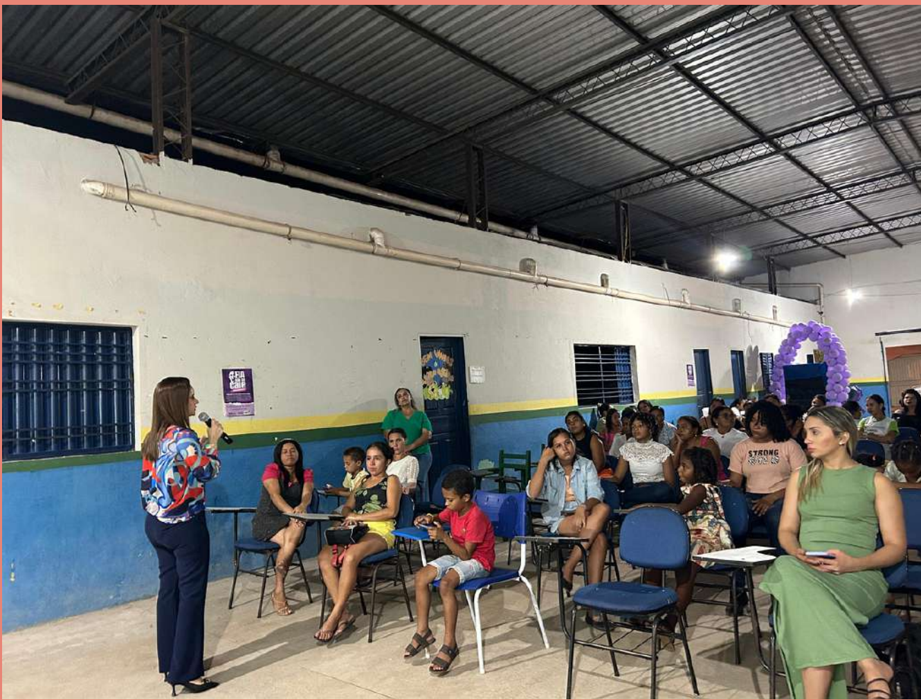
Ciclo de Diálogos sobre a Lei Maria da Penha realizado em Davinópolis, sendo parte do recomendação Nº 89/2022 do CNMP. O evento contou com a participação Secretaria de Saúde do Município e a Patrulha Maria da Penha.