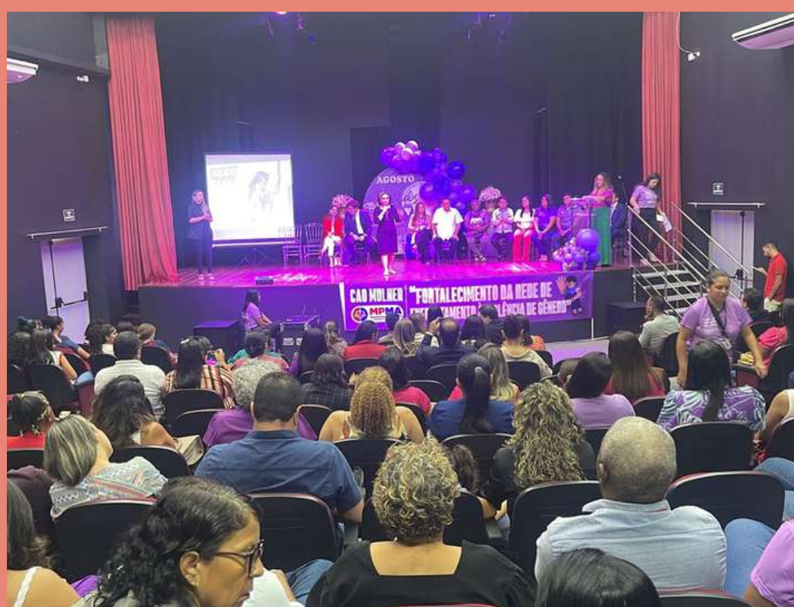
Público presente no evento "Fortalecendo a rede no Enfrentamento à Violência de Gênero" realizado no município de Açailândia - MA.