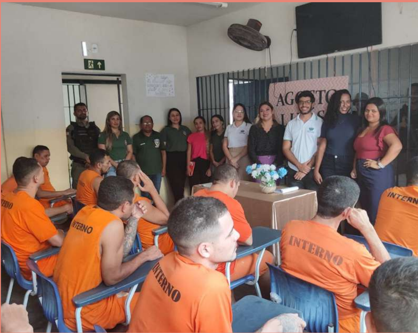
Visita à UPR de Zé Doca em alusão ao mês de conscientização pelo fim da violência contra mulher, agosto lilás.