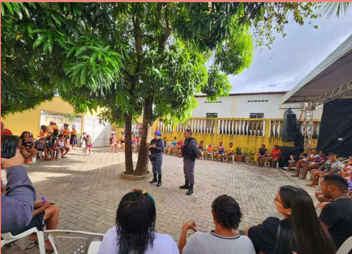
Representantes da Patrulha Maria da Penha em diálogo com o público presente na Roda de Conversa de Combate à Violência contra a Mulher na Casa das Pretas - Coroadinho.