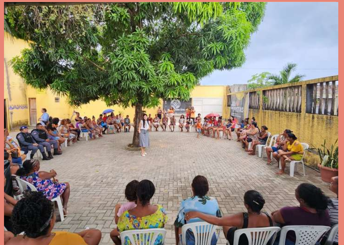
Público presente na Roda de Conversa de Combate à Violência contra a Mulher na Casa das Pretas - Coroadinho.

NO DIA 25 (VINTE E CINCO) DE JULHO, DIA INTERNACIONAL DA MULHER NEGRA, LATINO-AMERICANA E CARIBENHA, O CENTRO DE APOIO OPERACIONAL DE ENFRENTAMENTO À VIOLÊNCIA DE GÊNERO - CAO - MULHER - MARCOU PRESENÇA NO EVENTO ALUSIVO AO "JULHO DAS PRETAS", NA COMUNIDADE DO COROADINHO.