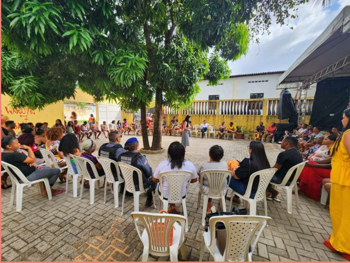
Público presente na Roda de Conversa de Combate à Violência contra a Mulher na Casa das Pretas - Coroadinho.