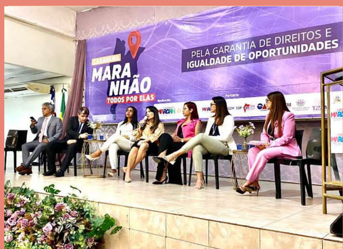
Mesa presente na Caravana da Mulher "Todas as Elas" no município de Barra do Corda.

EM PARCERIA COM A SECRETARIA DE ESTADO DA SEGURANÇA PÚBLICA, ÓRGÃOS ESTADUAIS, MUNICIPAIS E ENTIDADES CIVIS, A CARAVANA "MARANHÃO TODOS POR ELAS" VISA PROMOVER A EQUIDADE DE GÊNERO EM TODO O ESTADO.